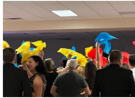
Batise în culorile steagului românesc.

S-a cântat atât muzică românească și din alte țări europene cât și muzică americană, muzică pop cât și populară, într-un reușit show muzical pentru toate gusturile și toate vârstele. S-a dansat hora, dar și “Brasoveanca”, “Dansul Pinguinului” și Macarena. Pentru hora “Unirii” s-au împărțit la mese “batiste de hârtie” roșie, galbenă și albastră. Altă notă plăcută pentru a marca caracterul românesc al evenimentului.