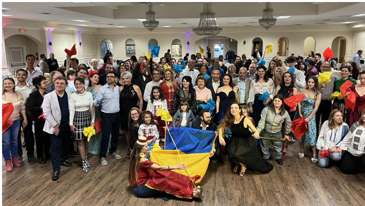
Poza de grup.

La sfârșit s-a luat o fotografie de grup.